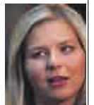
Står i det.